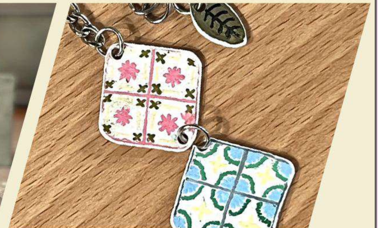
老花磚熱縮片吊飾