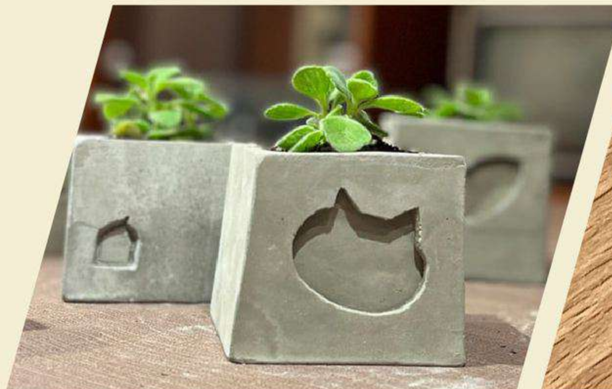
眷村圍籬水泥盆栽