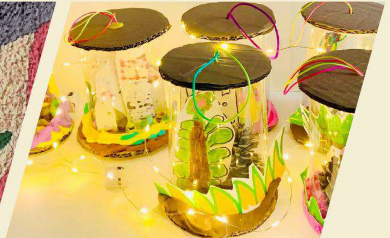
我的秘密花園小夜燈