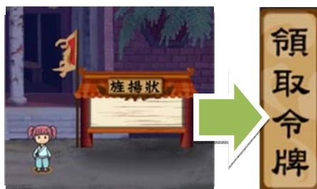
圖 5，關帝廟場景－旌揚狀，領取參賽令牌按鈕

參賽者需達到「才學徽章 Lv. 3」，至關帝廟場景中之「旌揚狀」，點選「領取令牌」按鈕(如圖 5)，將獲得「參賽令牌」做為參加競賽決選的資格，如圖 6 所示。