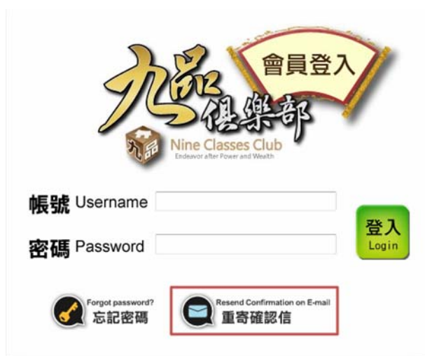
圖 1，按下「重寄認證信」按鈕

若是沒有收到認證信件、或是不慎填錯電子信箱，都可以由會員登入處的「重寄確認信」，如圖 1 所示，再次寄送認證信件。按下「重寄認證信」按鈕後，填入你的帳號、密碼以及正確欲送達的電子信箱(如圖 2)，按下「送出」，新的認證信將再次送出！