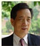
召集人 國立臺灣師範大學 黃光男 名譽教授