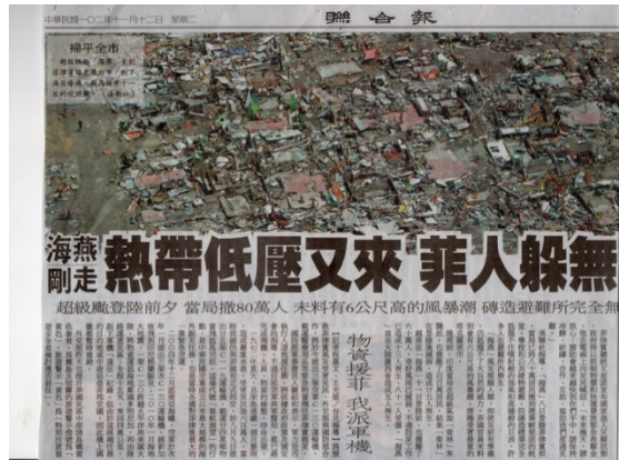
2013 年海燕颱風造成菲律賓嚴重傷亡與財產損失。