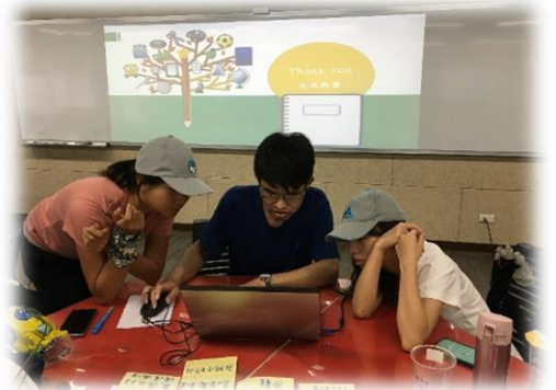
教案活動設計指引撰述